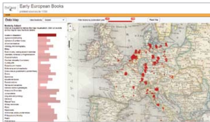
按主题筛选。选择一个主题来缩小地图可视化范围