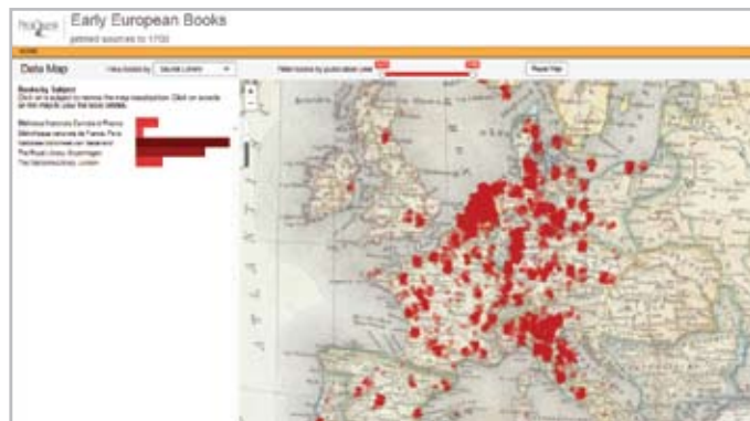
按来源图书馆筛选。